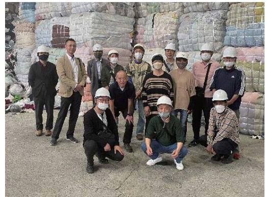
キムラセイの出荷前の古布のバール品の前で集合写真

埼玉県加須市に本社工場のあるキムラセイ様ではコンベアで流れてきた古布などを手選別で分類し、リユースとして国内やマレーシアの店舗で販売していると説明