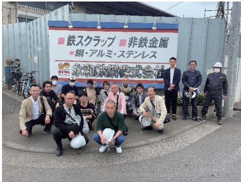
永和鉄鋼の入り口看板前で集合写真