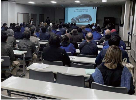
組合員 10 社およそ 100 名の運転手が参加して開催した安全講習会の様子

当日ご来賓として、東村山市環境資源循環部ごみ減量推進課より武田源太郎課長にお越し頂き、市の委託業務に関して責任をもつて